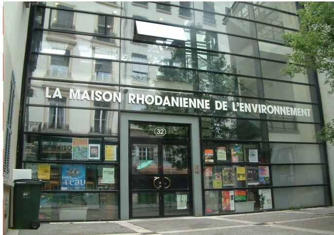
Maison Rhodanienne de l'Environnement - Lyon