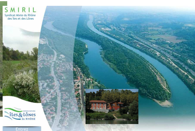
SMIRIL – Vernaison