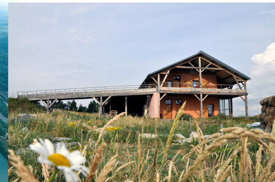
Ecocentre du Lyonnais la Tour de Salvagny