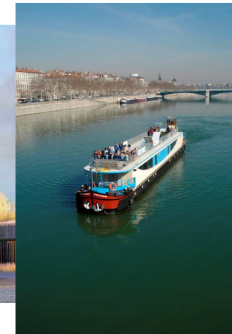
Péniche Val du Rhône