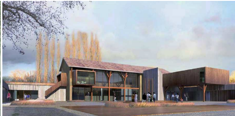
Centre de pédagogie eau et nature du Grand Parc de Miribel-Jonage – L'iloiz