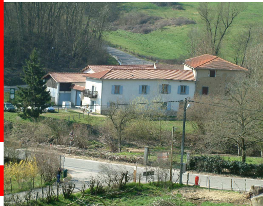
Grand Moulin de l'Yzeron-Francheville