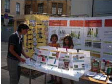
Apieu Mille Feuilles

(Inform and raise awareness of cleantiness and management of household waste)