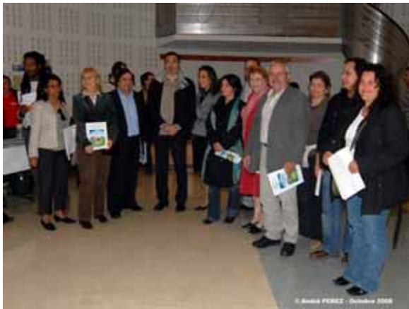
Centre social de Champvert (Lyon 9ème)