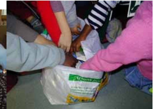
Direction de la propreté Grand Lyon