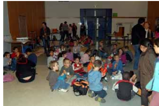
Centres sociaux d'Oullins