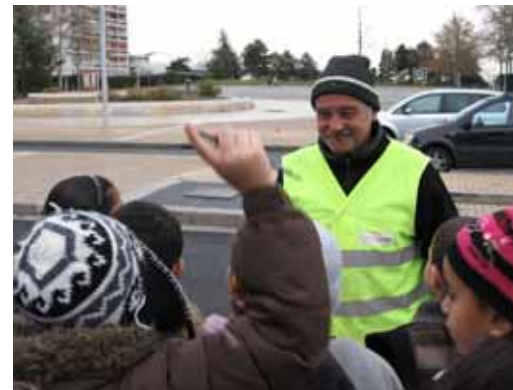
Direction de la propreté Grand Lyon