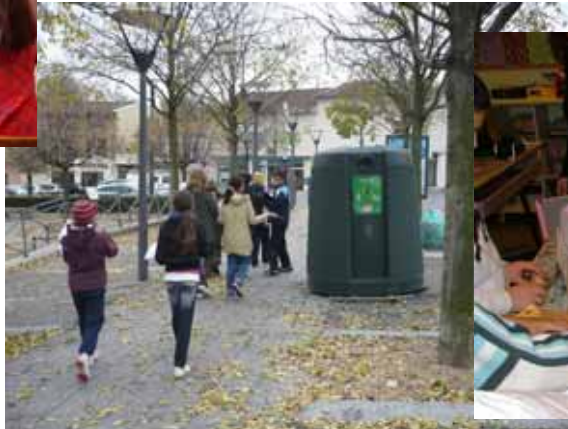
Apieu Mille Feuilles