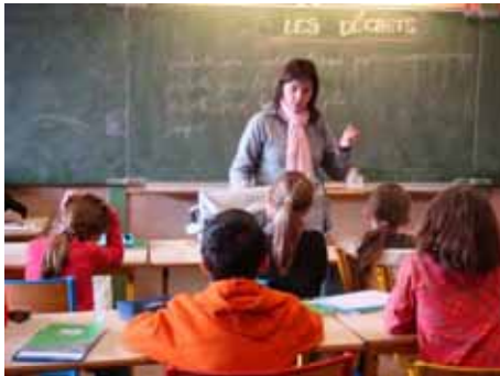
Animation sur les déchets Naturama