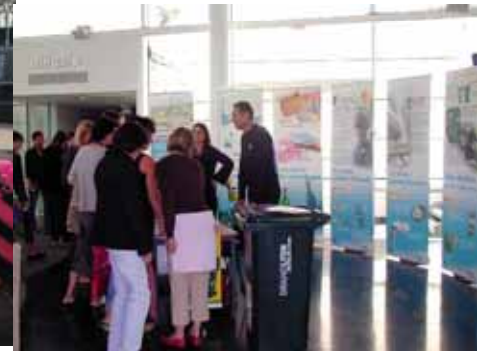
Direction de la propreté Grand Lyon