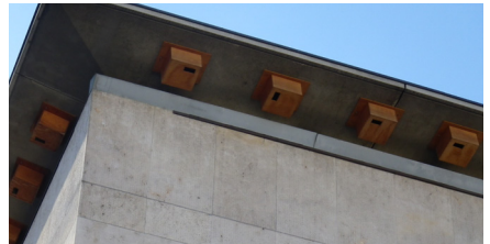
Nichoirs à Martinets, Vaise